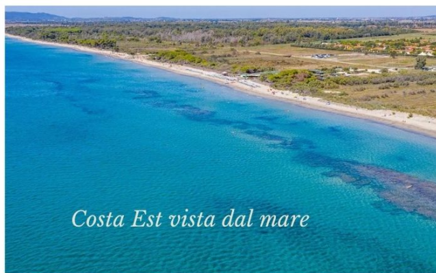
Costa Est vista dal mare